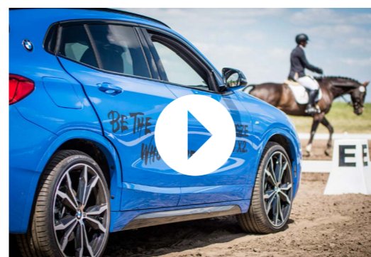
Dedykowany materiał wideo (Instagram, Facebook, TikTok)