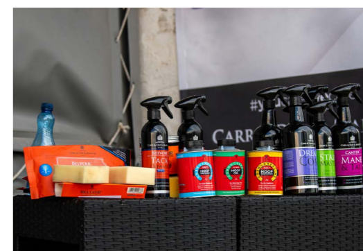
Dedykowany post (Instagram, Facebook)