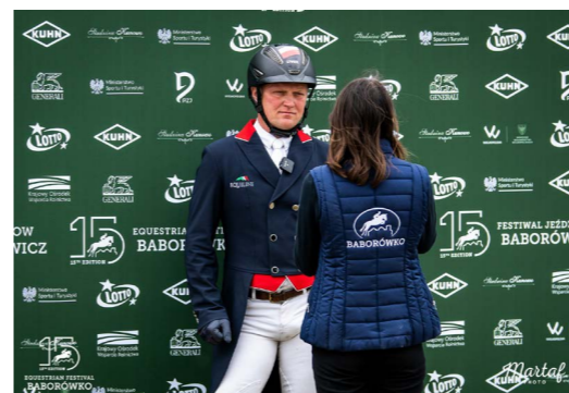
Ekspozycja logotypu (derka, trofeum, ścianki, katalog, plakaty)