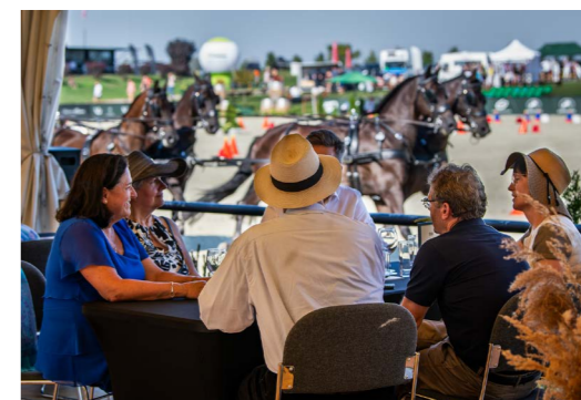
VIP (bilety, własna strefa)